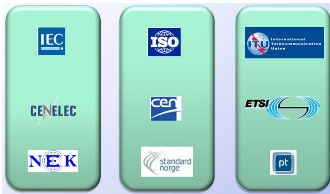
Figur: Oversikt over global-, europeisk- og norsk standardisering

ISO ser ut til å legge størst vekt på «Energy Management» hos bygningsforvaltere. IEC strekker på sitt nett over hele verdikjeden innen kraftforsyningen. De er en aktiv aktør gjennom sitt program «Roadmap for Smart Grid». Dette programmet inneholder satsing både innen sol og vindkraft, intelligente styringssystemer innen kraftforsyning, smarte målere og styring av laster. Til sist har ITU sin «Focus Group on Smart Grid» som har hatt et tilsvarende program for å standardisere innen ekom. Store deler av ekom ivaretas imidlertid av IEC på dette området. Figuren under illustrerer «de tre søyler innen standardiseringsarbeidet; el og ekom til venstre, allmennstandardiseringen i midten og telestandardiseringen til høyre.